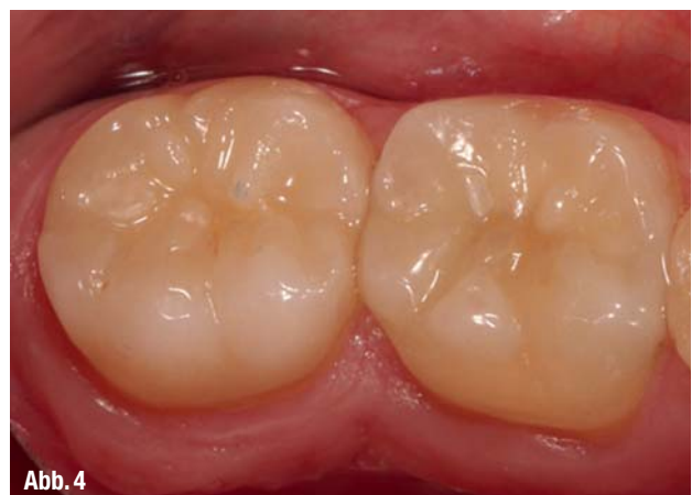
▲ Abb. 3 und 4: Ein Chamäleoneffekt, der seinem Namen Ehre macht: Nach einer bloßen Politur passt sich das Inlay aus zirkonoxidverstärktem Lithiumsilikat (ZLS) im Mund an seine Umgebung an – sogar ohne Bemalung und Glasur.