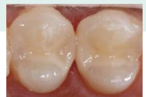
Finale Restauration mit EQUIA Forte