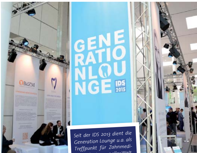
Seit der IDS 2013 dient die Generation Lounge u.a. als Treffpunkt für Zahnmedizinstudenten aus aller Welt.