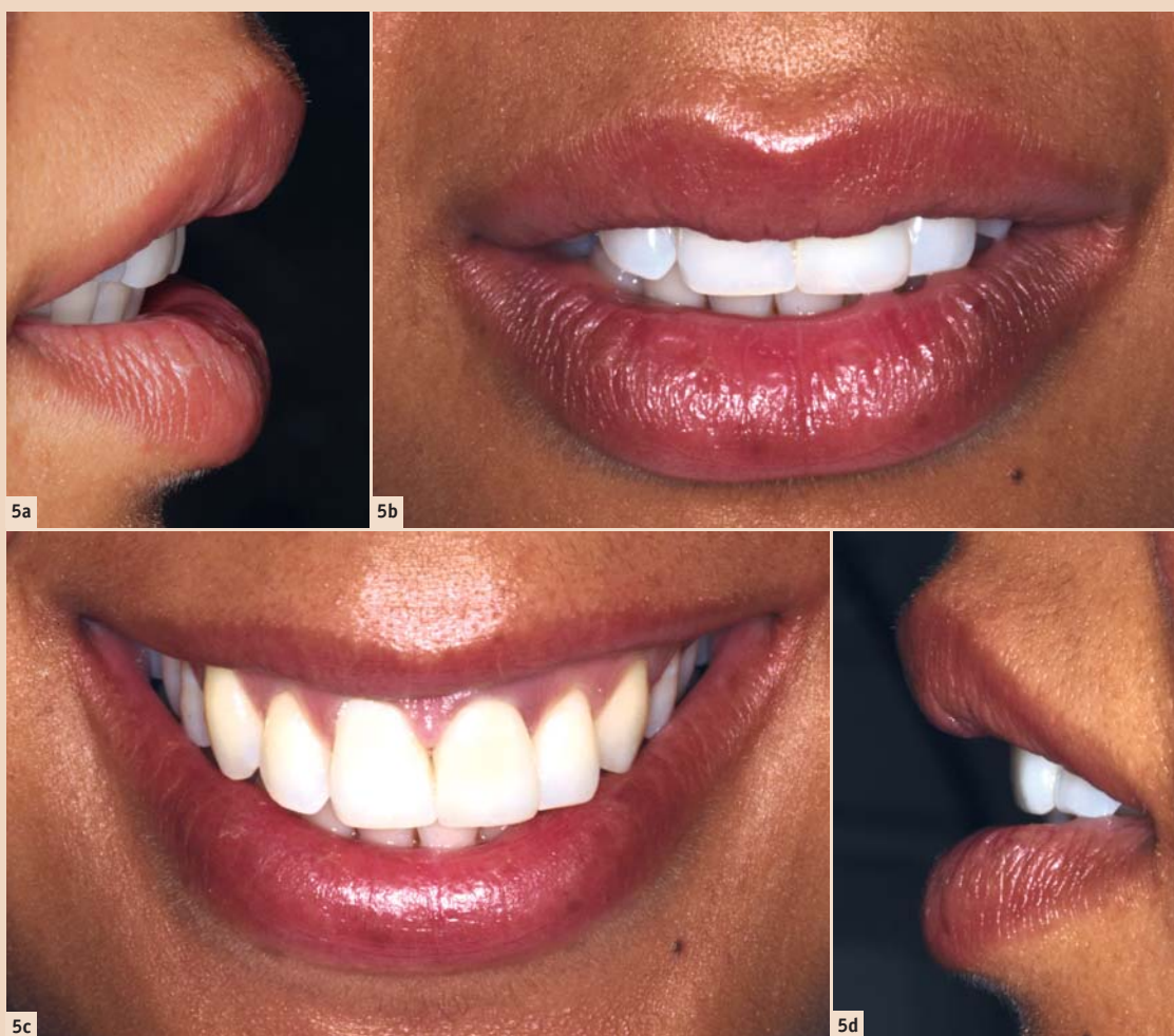
Abb. 5a–d: Klinische Situation in der Ästhetikkontrolle. Die Veneer-Krone an Zahn 21 weist nach der Achsenkorrektur sowohl in der dynamischen, als auch in der statischen Situation eine harmonische Integration.