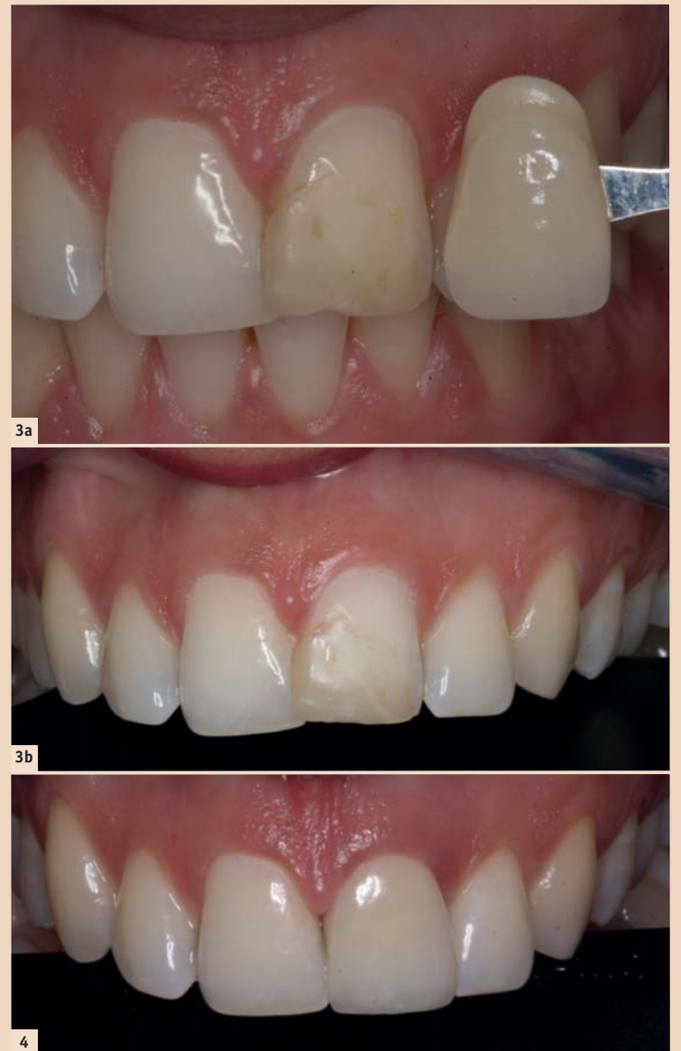
Abb. 3a: Zahn 21 vor dem internen Bleichen. – Abb. 3b: Schlussbild nach dem internen Bleichen. – Abb. 4: Schlussbild nach der Zementation der Veneer-Krone.

All diese Bemühungen für das Einhalten einer minimalinvasiven Rehabilitation mit einem guten Langzeiterfolg basieren letztlich auf der korrekt durchgeführten Wurzelbehandlung nach der Vorlage des aseptischen Konzepts, d.h. Kofferdam, potentes Spülmittel, dichtes Provisorium. Das Ziel der endodontischen Behandlung ist daher die möglichst vollständige Eliminierung aller lebensfähigen Mikroorganismen aus dem Wurzelkanalsystem. Es wird dazu eine chemo-mechanische Kanalaufbereitung in Kombination mit einer potenten antibakteriellen Spüllösung, NaOCl 3% und einer medikamentö-