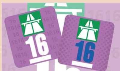
So sieht die Autobahnvignette 2016 aus.

menarbeit und Verlässlichkeit. Davon profitieren Zahnärzte, Dentalassistentinnen oder Dentalhygienikerinnen gleichermaßen.