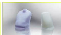
INFIX®-Krone as machined Frontzahn