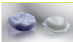
INFIX®-Krone as machined