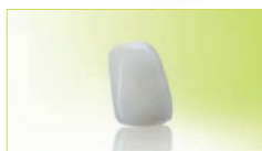
INFIX®-Krone finished Frontzahn