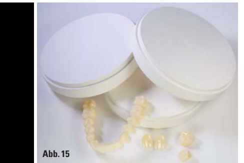
Abb. 10: Vollanatomische Seitenzahnkrone aus einem priti®multidisc Translucent Rohling leicht individualisiert mit Malfarbe. – Abb. 11: Steigerung des Transluzenzgrades durch kubisch-tetragonales Mischgefüge: tetragonales Gefüge (links) und kubisch-tetragonales Mischgefüge (rechts). – Abb. 12: pridenta® Rohling multicolor mit harmonischem Farbverlauf. – Abb. 13 und 14: Restauration aus priti®multidisc High Translucent multicolor Zirkonoxid. – Abb. 15: Neue Zirkonoxid-Materialvarianten werden auch zukünftig neue Indikationsgebiete erschließen.

habung im Labor bis hin zu verschiedenen ZrO 2 -Materialvarianten, die bei bestimmten Indikationen ein optimaleres Ergebnis erzielen, weitet sich das Spektrum immer weiter aus. Der Wunsch, ein Material für viele Indikationen zu nutzen, bedeutet nun, dass die Materialkennwerte innerhalb dieser Materialgruppe variieren. Zirkonoxid ist somit nicht mehr gleich Zirkonoxid.