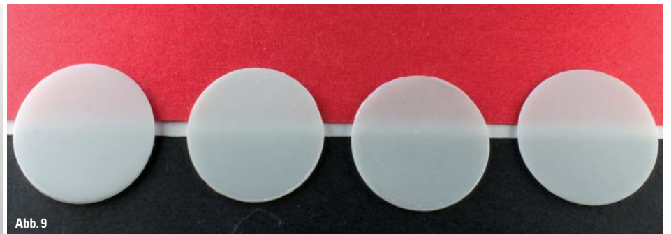
Abb. 1: Vorgesinterte (Weißlinge) Zirkondioxidblöcke zur CAM-Fertigung. – Abb. 2: Maschinelle Bearbeitung ermöglicht eine hohe Prozesssicherheit. – Abb. 3: Ästhetische, vollaratomische Restaurationen waren mit den anfänglichen Zirkonoxid-Materialien nicht möglich. – Abb. 4: Einfärbelösung als Ansatz für eine Kolorierung der Gerüste. – Abb. 5: Der Grad der Einfärbung wird von vielen Faktoren beeinflusst. – Abb. 6: Die Einfärbung erfolgt nur oberflächlich. – Abb. 7: Unterschiedliche Gerüststärken bedingen unterschiedliche Farbintensitäten. – Abb. 8: Farbskala für industriell voreingefärbte Zirkonoxidrohlinge. – Abb. 9: Unterschiedliche Transluzenzgrade von Zirkondioxid mit tetragonalem Gefüge.

gepaart mit einer geringen Fehleranfälligkeit in der Verarbeitung (im Vergleich zu anderen Vollkeramikmaterialien), ermöglichte diese Verbreitung (Abb. 2).