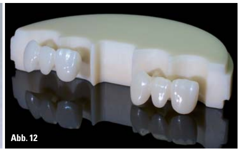
Abb. 10: Vollanatomische Seitenzahnkrone aus einem priti®multidisc Translucent Rohling leicht individualisiert mit Malfarbe. – Abb. 11: Steigerung des Transluzenzgrades durch kubisch-tetragonales Mischgefüge: tetragonales Gefüge (links) und kubisch-tetragonales Mischgefüge (rechts). – Abb. 12: pridenta® Rohling multicolor mit harmonischem Farbverlauf. – Abb. 13 und 14: Restauration aus priti®multidisc High Translucent multicolor Zirkonoxid. – Abb. 15: Neue Zirkonoxid-Materialvarianten werden auch zukünftig neue Indikationsgebiete erschließen.

habung im Labor bis hin zu verschiedenen ZrO 2 -Materialvarianten, die bei bestimmten Indikationen ein optimaleres Ergebnis erzielen, weitet sich das Spektrum immer weiter aus. Der Wunsch, ein Material für viele Indikationen zu nutzen, bedeutet nun, dass die Materialkennwerte innerhalb dieser Materialgruppe variieren. Zirkonoxid ist somit nicht mehr gleich Zirkonoxid.