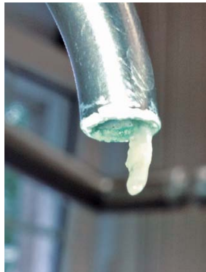
Biofilme in dentalen Behandlungseinheiten