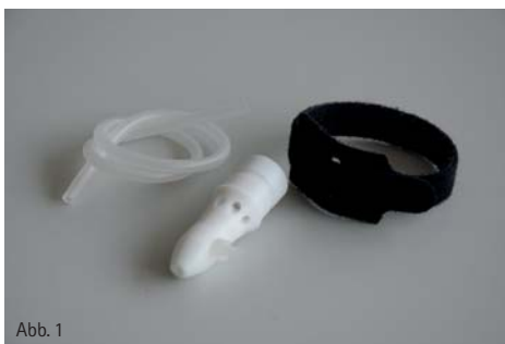
Abb. 1 bis 4: Düsenaufsätze für verschiedene Anwendungsfälle (1, 2) Nadeldüse für die Innenbehandlung von Sacklöchern und Kavitäten und die Nutzung von Sondergasen. Düsenansatz für die flächige Behandlung von sensiblen oder leitfähigen Oberflächen (3, 4).

Zwei Typen von atmosphärischen Plasmasystemen dominieren die medizinischen und medizintechnischen Anwendungen: Dielektrische Barriereentladungen (dielectric barrier discharge,