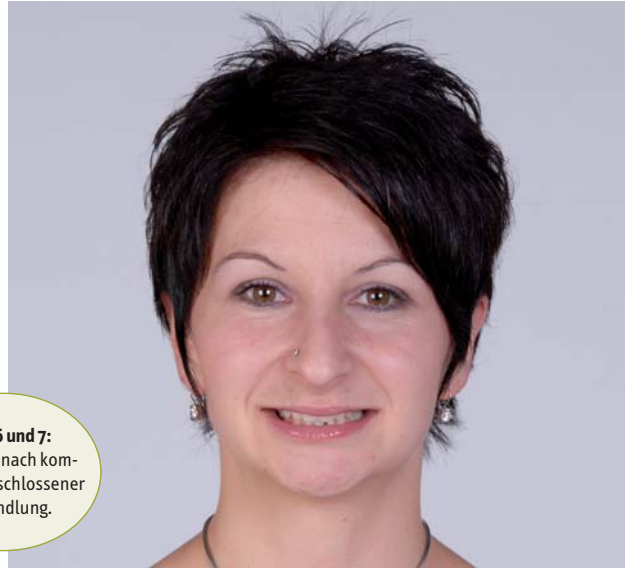
Abb. 6 und 7: Situation nach komplett abgeschlossener Behandlung.