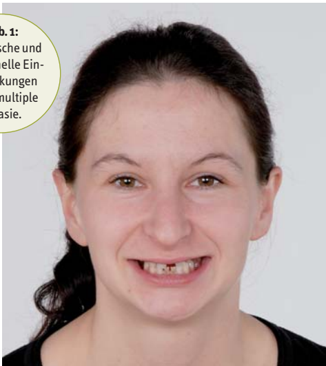
Abb. 1: Ästhetische und funktionelle Einschränkungen durch multiple Aplasie.