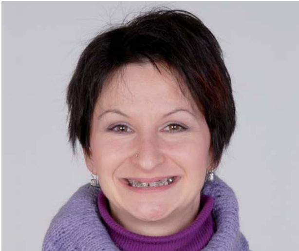
Abb. 3: Kieferorthopädische Vorbehandlung mit Multiband.