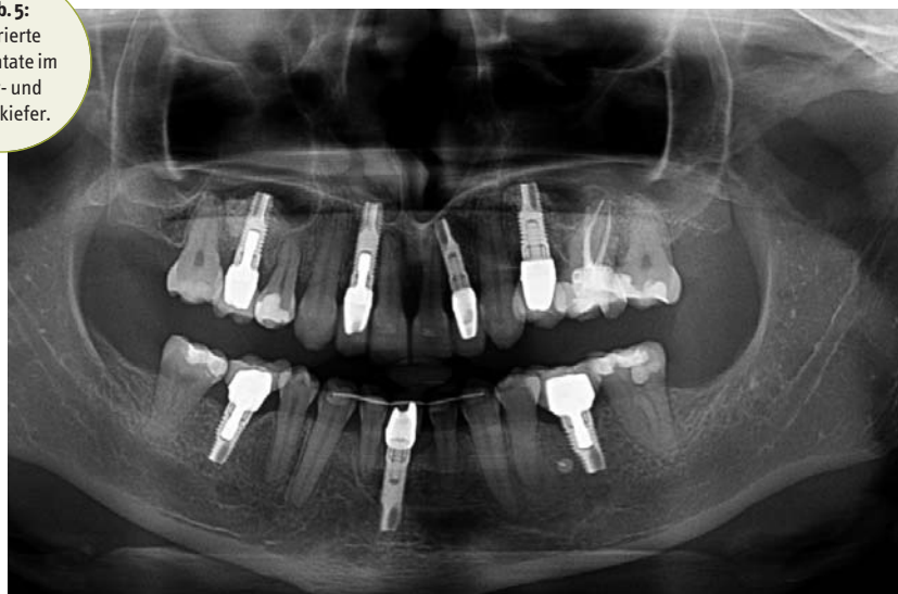
Abb. 5: Inserierte Implantate im Ober- und Unterkiefer.

Zahnbogen Voraussetzung für das Setzen von Zahnimplantaten. Die Schaffung optimaler Zahnbreitenverhältnisse ermöglicht die Anfertigung von funktionellem und äs-