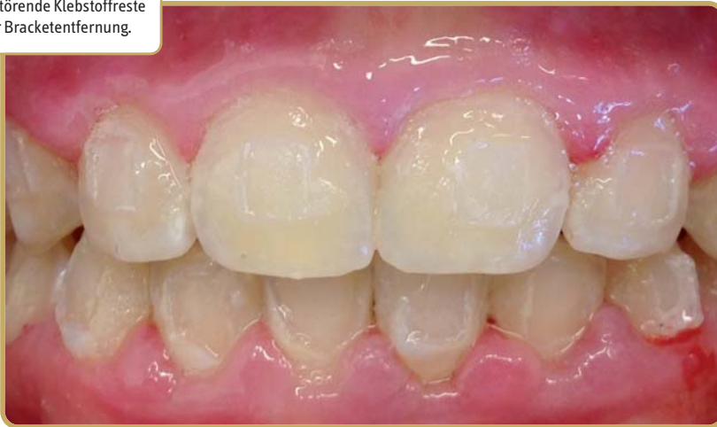
Abb. 1: Störende Klebstoffreste nach der Bracketentfernung.