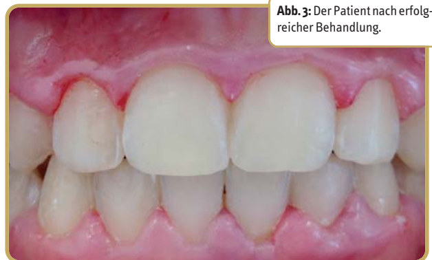
Abb. 3: Der Patient nach erfolgreicher Behandlung.