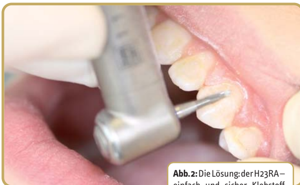
Abb. 2: Die Lösung der H23RA – einfach und sicher Klebstoff entfernen.

Vestibulär greife ich zum Klebstoffentferner H23RA (Abb. 2 und 4). Wer das Instrument zum ersten Mal in den Händen hält, wird merken, dass es ein komplett neues Arbeitsgefühl vermittelt. Der H23RA ist aggressiver als herkömmliche Klebstoffentferner, der Materialabtrag erfolgt sehr schnell und eher modellierend, ohne den sonst üblichen Widerstand. Hierdurch erweist er sich besonders bei der Entfernung von großen Kleberrückständen als sehr hilfreich.