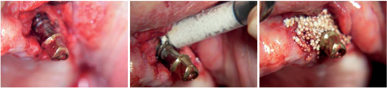
Abb. 8: Das dekontaminierte Implantat. – Abb. 9: Augmentation mit einem synthetischen Knochenersatzmaterial. – Abb. 10: Zustand nach Applikation des KEM im Überschuss.

– Laserlichtapplikation mit abtragender Wirkung: ablatives Vorgehen (ggf. mit Dekontamination)