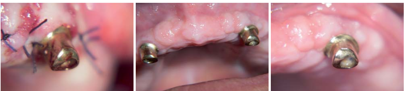
Abb. 11: Intraoraler Nahtverschluss nach Abschluss der Periimplantitistherapie. – Abb. 12 und 13: Drei-Monats-Kontrolle im OK total und in Regio 23.

Deppe war mit seinen Koautoren der Beweis gelungen, dass der bis dato in der Periimplantitistherapie kritisch betrachtete Gas-Laser hier sinnvoll eingesetzt werden kann und später – nach Abklingen der periimplantären Infektion – günstige Ausgangssituationen für eine Stützgewebsregeneration erzielt werden können. Deppe gibt