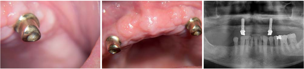
Abb. 14 und 15: Zwei-Jahres-Kontrolle im OK total und in Regio 23. – Abb. 16: Panoramaschichtaufnahme 24 Monate nach der chirurgisch-resektiven und augmentativen Phase aufgenommen – der zirkuläre Defekt in Regio 23 ist rekonstruiert.

hierbei die Verwendung des CO 2 -Lasers im continuous-wave (cw)-Verfahren mit einer Leistung von 2,5 W über zehn Sekunden an. Er arbeitet hierbei mit einem Scanner; ggf. zusätzlich mit dem Einsatz eines Pulverstrahlgerätes und der postoperativen Applikation einer Membran. Auch hier liegt eine Fünf-Jahres-Studie vor (Deppe und Horch, 2005).