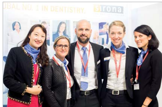
Abb. 1: Auf der SinoJobs-Messe standen HR-Mitarbeiter von Sirona den interessierten chinesischen Bewerbern für Fragen zur Verfügung. – Abb. 2: Der Sirona-Stand auf der Messe in München war eine gut besuchte Anlaufstelle für Bewerber.

Für das China-Geschäft sucht Sirona motivierte Kandidaten: „Aufgrund unseres stetigen Wachstums in China steigt der Bedarf an Mitarbeitern aller Fachrichtungen. Wir sind auf der