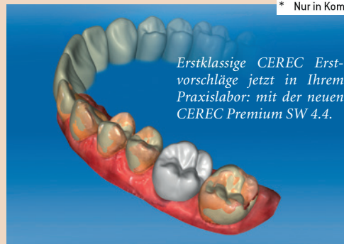
Erstklassige CEREC Erstvorschläge jetzt in Ihrem Praxislabor: mit der neuen CEREC Premium SW 4.4.

* Nur in Kombination mit Abutments und Verblendstruktur (Veneer-Struktur).