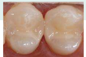
Finale Restauration mit EQUIA Forte

GC Germany GmbH Seifgrundstrasse 2 61348 Bad Homburg Tel. +49.61.72.99.59.60 Fax. +49.61.72.99.59.66.6 info@gcgermany.de http://www.gcgermany.de