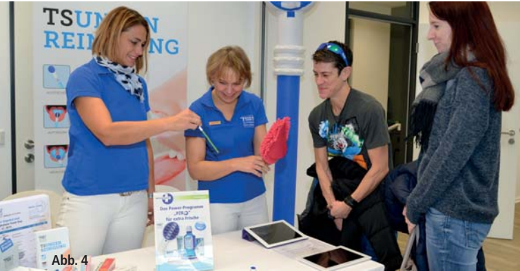
Abb. 3: Bereits zu Beginn des Vortragstages war im Auditorium kein Platz mehr frei. – Abb. 4: Die begleitende Industrieausstellung stellte eine ideale Ergänzung zum Vortrags- und Workshopprogramm dar.

9. April 2016 | Hamburg EMPIRE RIVERSIDE HOTEL