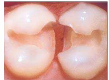
Stabile Blutstillung, saubere Präparation