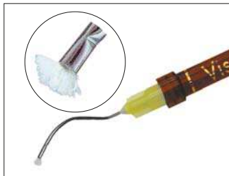
Spritze mit Dento Infusor-Tip