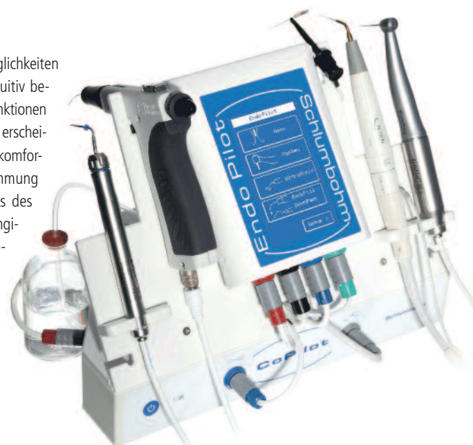
EndoPilot Set „ultra premium“

Komet Dental Tel.: 05261 701-700 www.kometdental.de