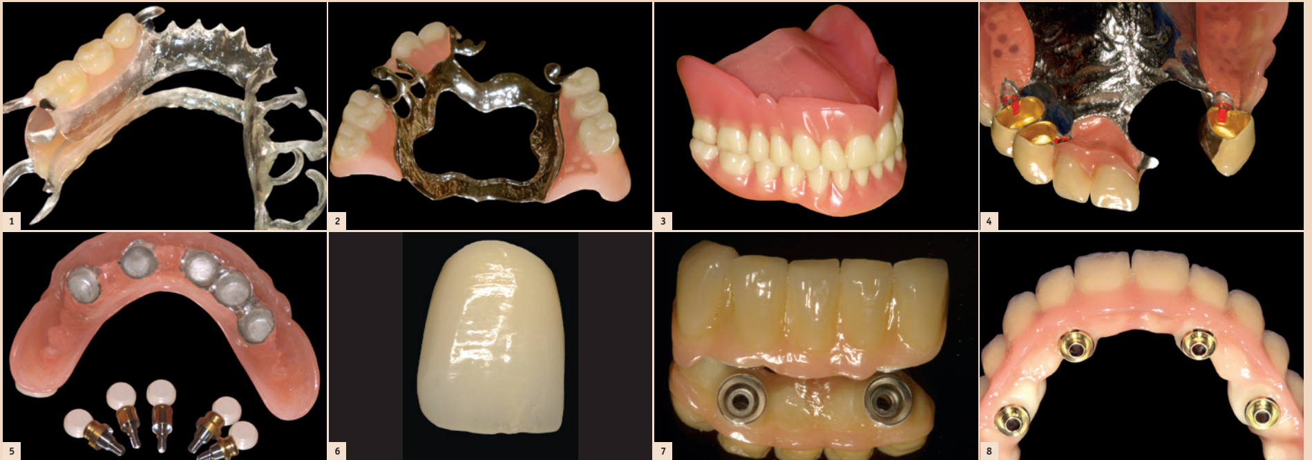
Abb. 1: Clear Flex. – Abb. 2: Modellgussprothese. – Abb. 3: Totalprothesen. – Abb. 4: Teleskopprothese. – Abb. 5: Hybridprothese. – Abb. 6: Zirkonkrone individuell geschichtet. – Abb. 7: Implantat-Zirkonbrücke auf zwei Implantaten, direkt verschraubt. – Abb. 8: Totale Implantat-Zirkonbrücke auf vier Implantaten, direkt verschraubt.

Immer mehr Zahnersatz-Patienten wandern ins vermeintlich kostengünstige Ausland ab. Das Resultat ist ein harter Verdrängungswettbewerb im Schweizer Markt, mit absehbaren Auslastungsproblemen und ruinösen Preiskämpfen.