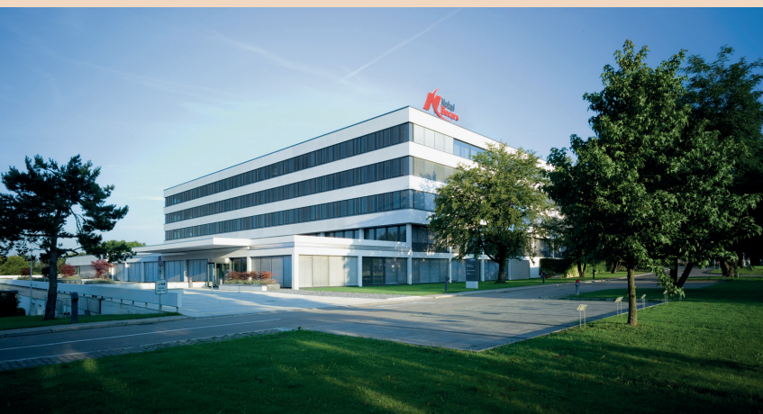
Hauptsitz des Unternehmens Nobel Biocare in Kloten (Kanton Zürich), Schweiz.