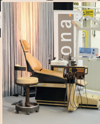
Der Klassiker M1 von Sirona – eine der bestverkauftesten Behandlungseinheiten.