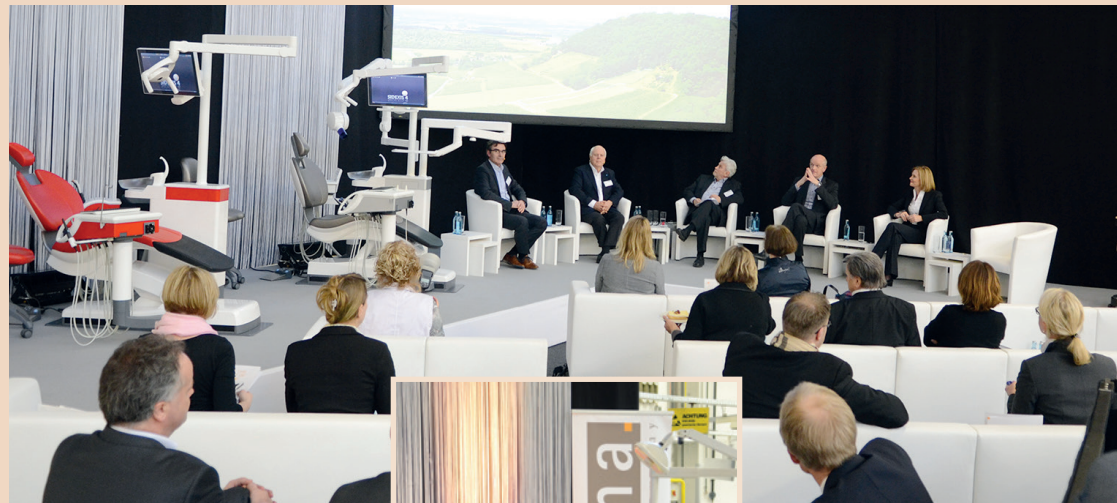
Media Lounge direkt in den Fertigungshallen für Sirona-Behandlungseinheiten in Bensheim.

Die Investition in eine neue Praxisausstattung muss rechtzeitig ge-