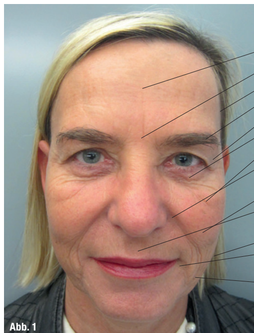
Abb. 1: Typische Alterserscheinungen im Gesicht.

Zum Zweiten kommt es, neben dem progressiven Fettgewebsabbau, hauptsächlich im Wangen- und Schläfenbereich zu einem Absinken des Weichteilmantels (Muskulatur und Fettgewebe). Dieser Effekt wird durch den Knochenabbau (zum Dritten), vor allem im Bereich der Orbita, der Maxilla sowie der Mandibula verstärkt. 1 Weitere typische Alterserscheinungen werden durch die fixen Retaining Ligaments (osteocutane Ligamente) verursacht, die die Haut mit dem Knochen verbinden. Aufgrund der paramentalen