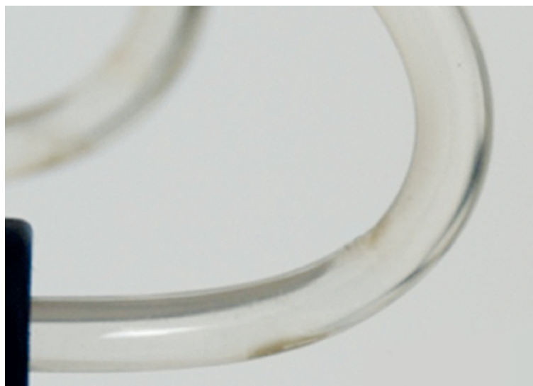
Mit SAFEWATER von BLUE SAFETY

Trends 2016 – Kleingeräte und Materialien