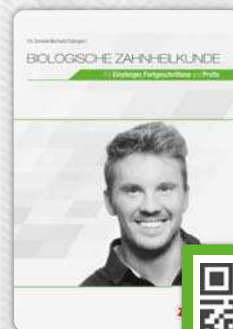
zum Programm via QR-Code