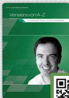
DVD-Vorschau via QR-Code