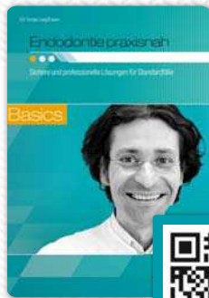
DVD-Vorschau via QR-Code