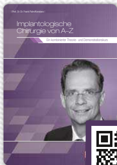
DVD-Vorschau via QR-Code