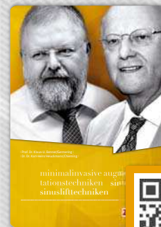
DVD-Vorschau via QR-Code