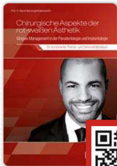
DVD-Vorschau via QR-Code