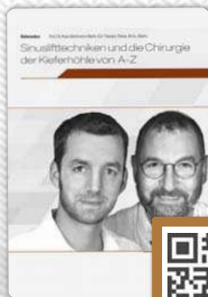
DVD-Vorschau via QR-Code