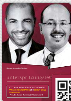
DVD-Vorschau via QR-Code