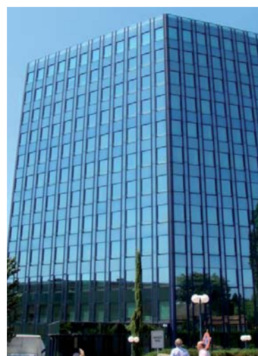
Neue FDI-Hauptverwaltung in Genf, Schweiz.

FDI World Dental Federation Tour de Cointrin Avenue Louis Casai 84 Case Postale 5 1216 Cointrin – Genève Switzerland