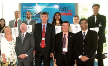
Vertreter von FDI und Unilever und die Gewinner des Posterwettbewerbs 2009.

Gesellschaftsschichten Anlass sein, über ihre eigene Mundgesundheit nachzudenken. FDI