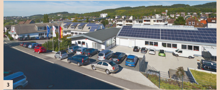
Abb. 1: Unternehmensgründung in Hagen (Westf.). – Abb. 2: Die Zahnarztpraxis von Rudolf Scheu. – Abb. 3: SCHEU-DENTAL Iserlohn.

für regelmässige Weiterbildungen und Schulungen für Zahnmediziner und -techniker, von CA® CLEAR ALIGNER und TAP®-Zertifizierungskursen bis hin zu Tiefzieh-Workshops sowie Kurse, die in die digitale Prozesskette der Kieferorthopädie einführen.