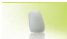
INFIX®-Krone finished Frontzahn