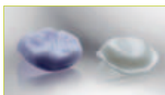
INFIX®-Krone as machined