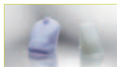
INFIX®-Krone as machined Frontzahn