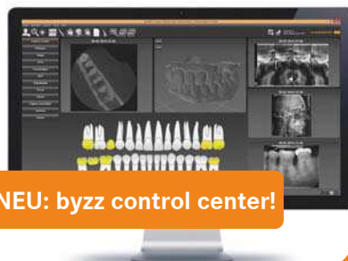
NEU: byzz control center!