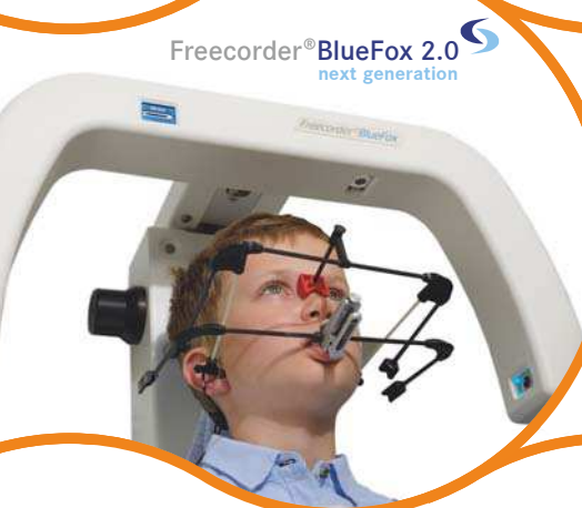
Freecorder® BlueFox 2.0 next generation