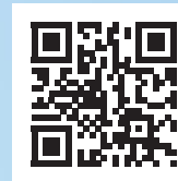
Programm der 13. Jahrestagung der DGKZ