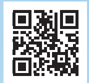
Cosmetic Dentistry Ausgabe 1/2016

Faxantwort 0341 48474-290 oder per Post an