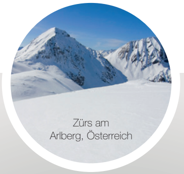
Zürs am Arlberg, Österreich

Der 13. Internationale Jahreskongress der DGOI findet in diesem Jahr vom 30. September bis 1. Oktober im Europa-Park in Rust statt.