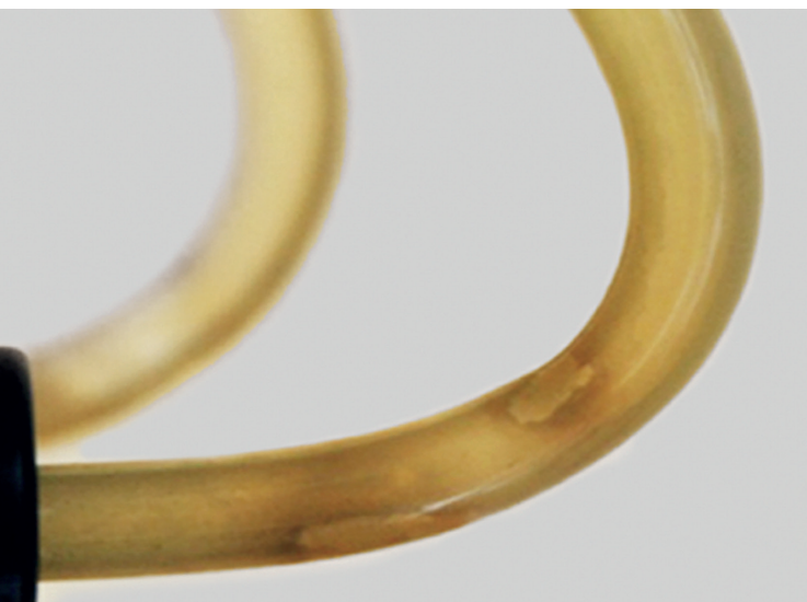
Wegen H_2O_2 : Biofilmbildung

Video-Erfahrungsberichte www.safewater.video