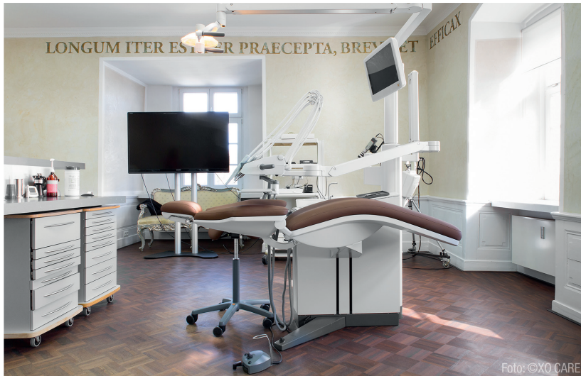
Abb. 2: Die Behandlungseinheit von XO CARE passt ideal zu Farbe und Gefüge des Raumes.