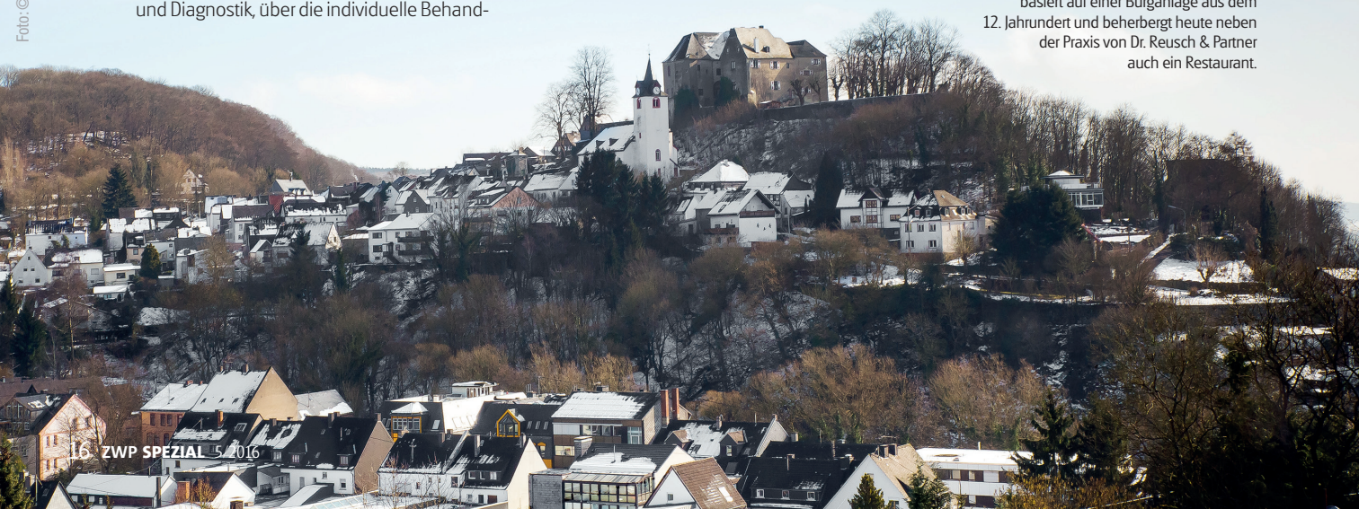
Abb. 1: Das Westerbürger Schloss basiert auf einer Burganlage aus dem 12. Jahrhundert und beherbergt heute neben der Praxis von Dr. Reusch & Partner auch ein Restaurant.

Die XO 4-Dentaleinheiten integrieren alle notwendigen Instrumente und Arbeitsprozesse und sind dabei darauf ausgerichtet, die einzelnen Schritte des täglichen Workflows am Behandlungsstuhl perfekt aufeinander abzustimmen. Der Behandler sitzt in jeder Arbeitsposition bequem, sieht gut und kann somit effizient, und voll und ganz auf den Patienten konzentriert, arbeiten.