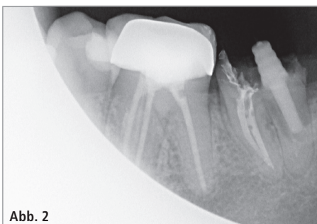
Abb. 1: Zahn 37 nach Verlust des Aufbaus und der Krone. – Abb. 2: Zahn 37 mit revidierter Wurzelfüllung und DentinPost X Coated.