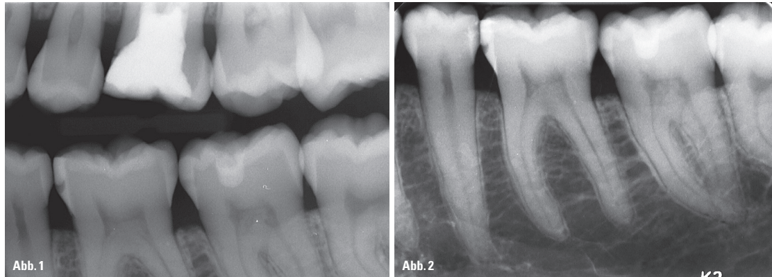
Abb. 1: Bissflügelaufnahme vom 18.11.2009 vor der Infiltrationsbehandlung mit Icon® (DMG) approximal, kariöser Defekt Regio 37 mesial, schmelzbezogen. – Abb. 2: Zahnfilm vom 22.11.2011 nach der Infiltrationsbehandlung mit Icon® (DMG) approximal, keine Veränderung des kariösen Defektes Regio 37 mesial.