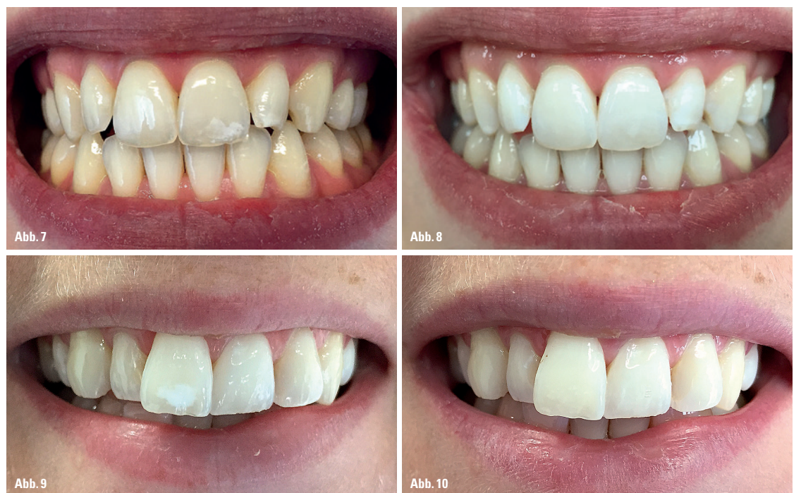
Abb. 7: Dentalfluorose 21, traumatische Farbveränderung 22. (DH) – Abb. 8: Situation nach der Infiltrationsbehandlung. (DH) – Abb. 9: Traumatische Farbveränderung 11. (DH) – Abb. 10: Das Ergebnis direkt nach der Therapie mittels Kariesinfiltrationsmethode. (DH)

Zusammenfassend kann sowohl aus den bisher publizierten Untersuchungen als auch aus den Erfahrungen in der eigenen Anwendung gefolgert werden, dass die Infiltrationstechnik eine wirksame Methode zur Verhinderung bzw. Verlangsamung der Progression initialer kariöser Läsionen und zur ästhetischen Korrektur bereits vorhandener Läsionen und damit eine interessante, mikroinvasive Ergänzung zu klassischen Ansätzen in der Kariestherapie darstellt. PN