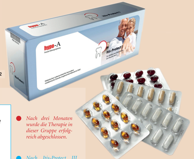
Abb. 1: Studienergebnisse von Olbertz et al. zeigen die Wirkung der hypoallergenen orthomolekularen Therapie auf den aMMP-8-Wert. – Abb. 2: Die kausale Parodontistherapie mit Itis-Protect I-IV unterstützt nachhaltig die Selbstheilungskräfte des Körpers und führt so in der Überzahl an Patientenfällen zu einer grundlegenden Heilung. – Abb. 3: Parodontitis ist als Allgemeinerkrankung anzusehen, die mit anderen systemischen Krankheiten eng verknüpft ist.

● Nach drei Monaten wurde die Therapie in dieser Gruppe erfolgreich abgeschlossen.