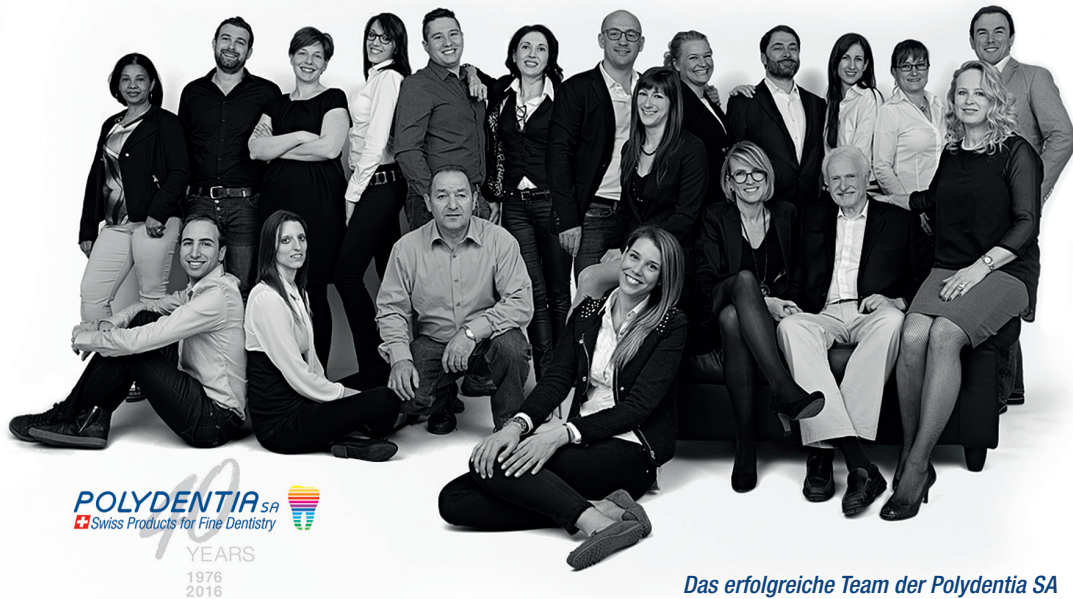
Das erfolgreiche Team der Polydentia SA