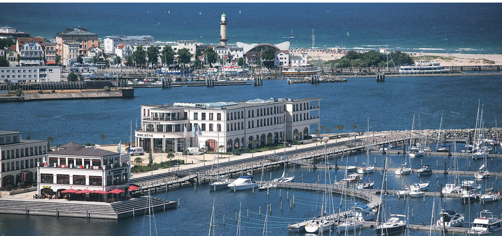
Abb. links: Yachthafenresidenz Hohe Düne in Rostock-Warnemünde.

Weitere Informationen und Anmeldungen sind telefonisch unter 040 32102-408, per E-Mail an veranstaltungen@flemming-dental.de oder unter www.flemming-dental.de/veranstaltungen/flemming-kongress ab sofort möglich.