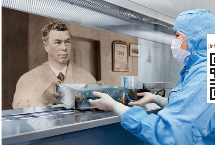
Geistlich Expertise in der Knochen- und Weichgewebearbeitung seit 165 Jahren.

Im Jubiläumsjahr 2016 feiert Geistlich Deutschland 20-jähriges Bestehen und hat gleich drei weitere Jubiläen zu feiern: 20 + 30 = 1.000