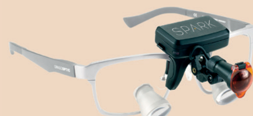
Spark Legend Twist HDL 2.5

XVI™ – Die weltweit erste kabellose Lupenbrille mit LED-Lichtsystem. Die Batterie-Betriebsdauer beträgt bei Einstellung NIEDRIG ca. fünf Stunden und bei Einstellung HOCH ca. drei Stunden. DI