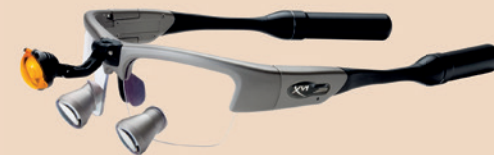
XVI Steel HDL 2.5