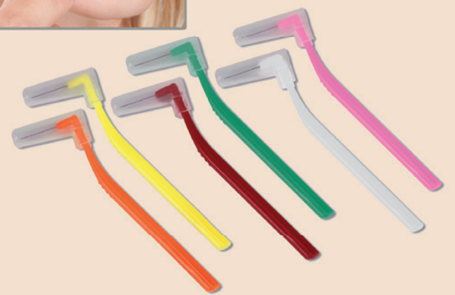
Die neue Interdentalbürste I-Prox® L mit L-förmigem Griff.

ummantelte Draht werden auf diese Weise vor Verunreinigung oder Schaden geschützt.