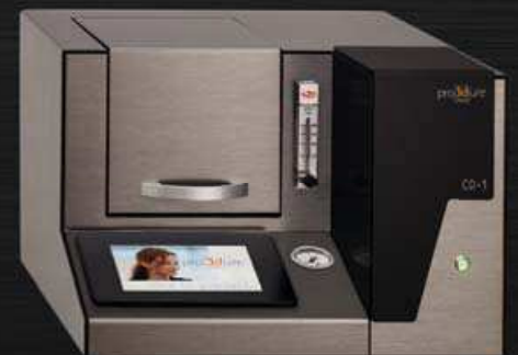
pro3dure CD-1 medical