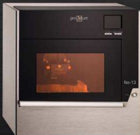
pro3dure fab-13 medical

Pano Athanasiou, Crossmill GmbH, Remscheid