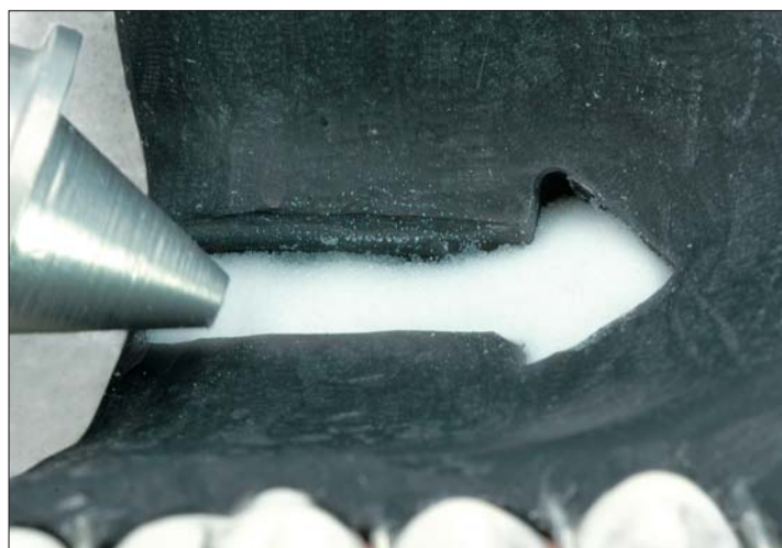
Abb. 6: Der ausgesparte Bereich wird mit Orthocryl white aufgefüllt...