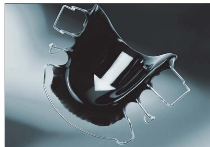
Abb. 12: Orthocryl black &amp; white mit klarem Monomer ...