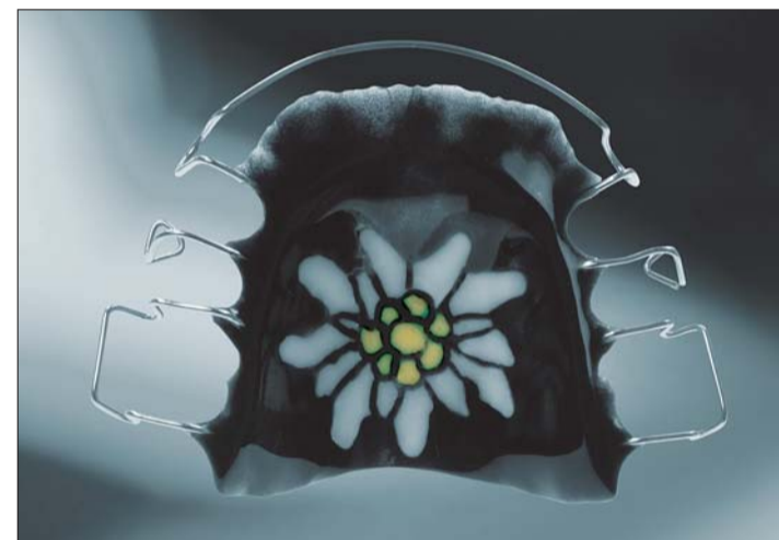
Abb. 13: ... klarem und gelben Monomer ...