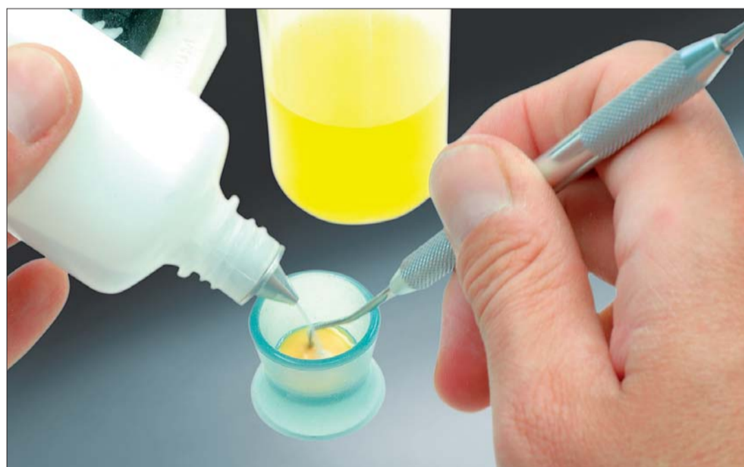
Abb. 9, 10: Details im Motiv werden mit einem Rosenbohrer eingefräst und mit Kunststoff der gewünschten Färbung (in diesem Fall Orthocryl white und gelbes Monomer)...