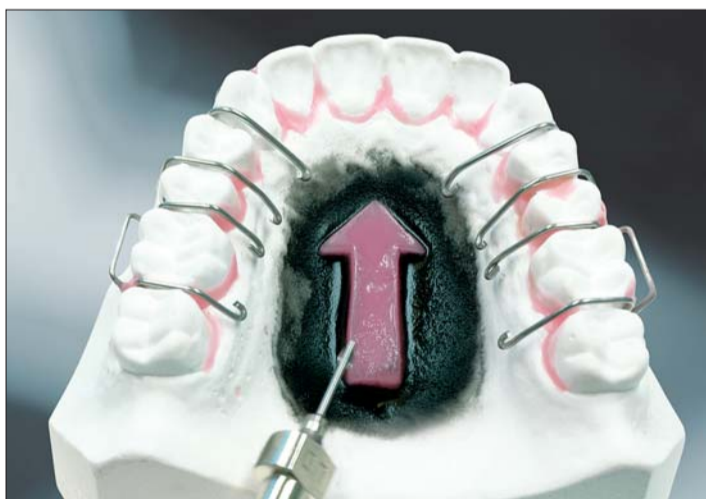
Abb. 3, 4: Wachsformen (doppelte Wachsplattenstärke) können bei der Gestaltung der Apparaturen für die groben Umrisse sorgen.