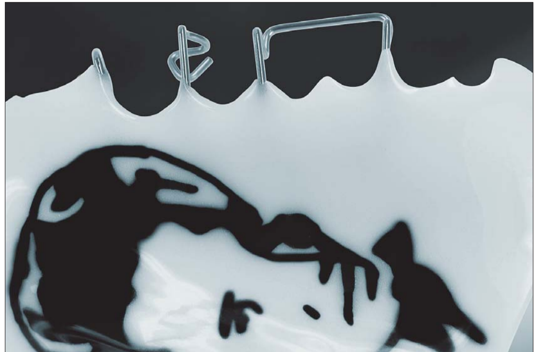
Abb. 2: Opakes Orthocryl black & white.