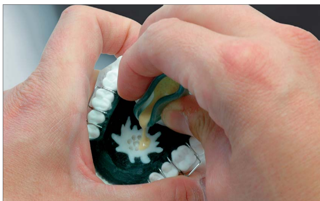
Abb. 11: ... aufgefüllt.