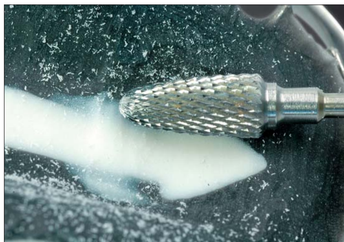
Abb. 7, 8: ... nach der Polymerisation verschliffen und wie gewohnt fertiggestellt.