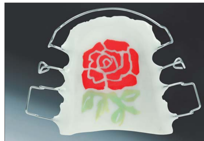
Abb. 14: ... klarem, grünen und roten Monomer.