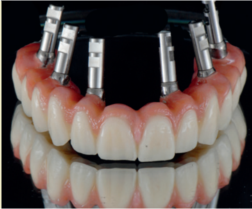
Implantatprothese mit cara I-Bridge und PalaVeneer.