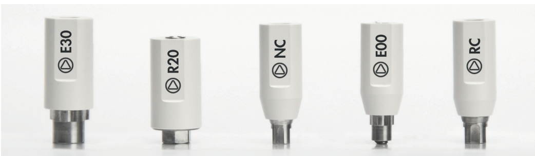
Die zweiteiligen Scanbodies aus hochwertigem PEEK-Kunststoff mit Edelstahl-Anschlussgeometrie sind für alle gängigen Implantatsysteme erhältlich.