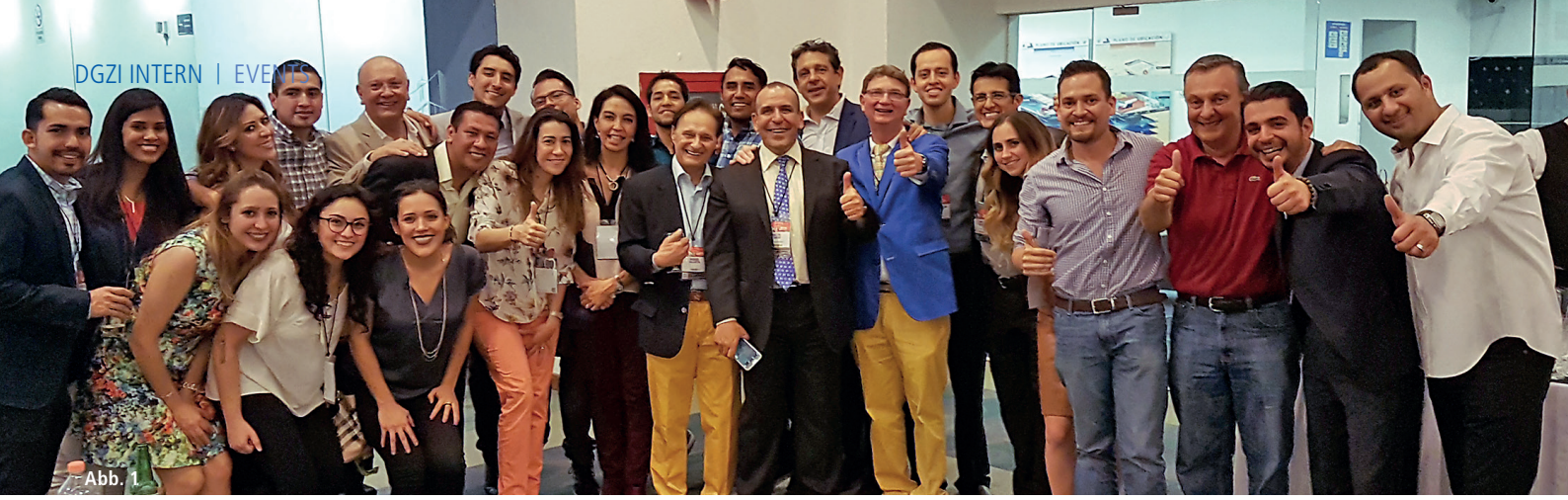
Abb. 1: Die Referenten des UNAM Kongresses. – Abb. 2: Die Kultur des Landes wurde in der Freizeit studiert.