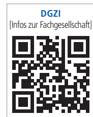
DGZI [Infos zur Fachgesellschaft]