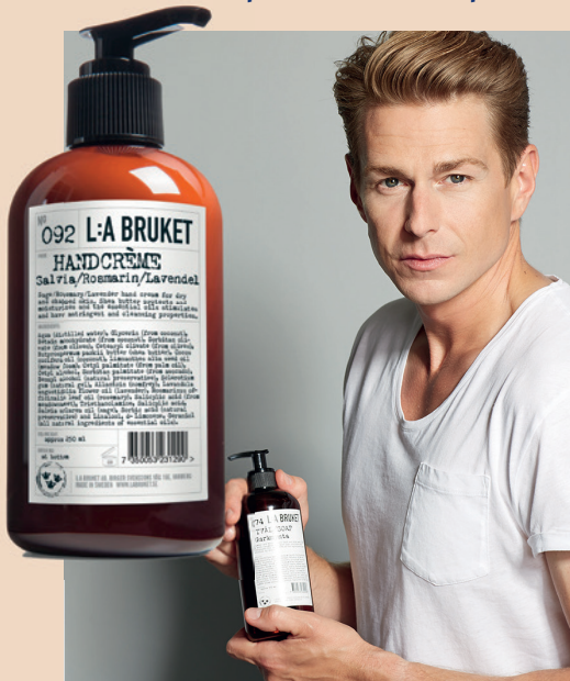
dentalman.com bietet mit L:A Bruket natürliche Kosmetik aus Schweden.

Onlineshop dentalman.com punktet mit neuartigem Konzept.