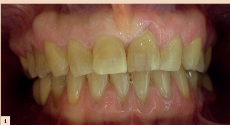
Abb. 1 und 2a: Ausgangssituation – Die Patientin stellte sich mit dem Wunsch einer Verbesserung ihrer Ästhetik vor. Aus Kostengründen sollte vorerst der Oberkiefer saniert werden, im Anschluss dann auch der Unterkiefer. – Abb. 2b: Das Endergebnis.