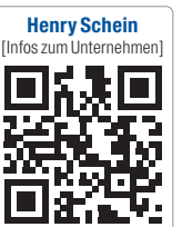
Henry Schein [Infos zum Unternehmen]

Henry Schein Dental Deutschland GmbH Monzastraße 2a 63225 Langen Tel.: 0800 1400044 Fax: 08000 400044 info@henryschein.de www.henryschein-dental.de