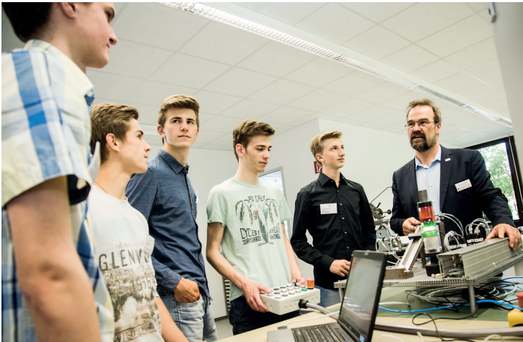
40 Schülerinnen und Schüler aus Bensheim und Umgebung nutzten am „Tag der Technik“ die Chance, technische Ausbildungsberufe live bei Dentsply Sirona in Bensheim zu erleben.

Spannendes Live-Erlebnis für Schülerinnen und Schüler bei Dentsply Sirona in Bensheim.