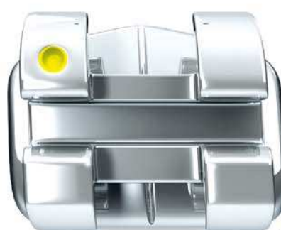
LEGEND mini Rhodium Coated