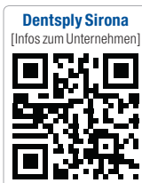
Dentsply Sirona [Infos zum Unternehmen]

Als größter Arbeitgeber der Region Bergstraße beschäftigt Dentsply Sirona mehr als 1.600 Mitarbeiter am Standort Bensheim. Dort bietet das Unternehmen in der eigenen Ausbildungswerkstatt rund 30 Ausbildungs- und Studienplätze pro Jahrgang an. Dazu gehören die technischen Studiengänge Elektrotechnik, Maschinenbau, Informationstechnik und Wirtschaftsingenieurwesen. Das Angebot der dualen Ausbildungsberufe umfasst Ausbildungsplätze in den Bereichen Mechatronik, Industriemechanik, Zerspanungsmechanik und Lagerlogistik. Zu Beginn des Ausbildungsjahres 2015 waren 114 Auszubildende und dual Studierende bei Dentsply Sirona beschäftigt.