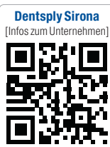
Dentsply Sirona [Infos zum Unternehmen]

Als größter Arbeitgeber der Region Bergstraße beschäftigt Dentsply Sirona mehr als 1.600 Mitarbeiter am Standort Bensheim. Dort bietet das Unternehmen in der eigenen Ausbildungswerkstatt rund 30 Ausbildungs- und Studienplätze pro Jahrgang an. Dazu gehören die technischen Studiengänge Elektrotechnik, Maschinenbau, Informationstechnik und Wirtschaftsingenieurwesen. Das Angebot der dualen Ausbildungsberufe umfasst Ausbildungsplätze in den Bereichen Mechatronik, Industriemechanik, Zerspanungsmechanik und Lagerlogistik. Zu Beginn des Ausbildungsjahres 2015 waren 114 Auszubildende und dual Studierende bei Dentsply Sirona beschäftigt.