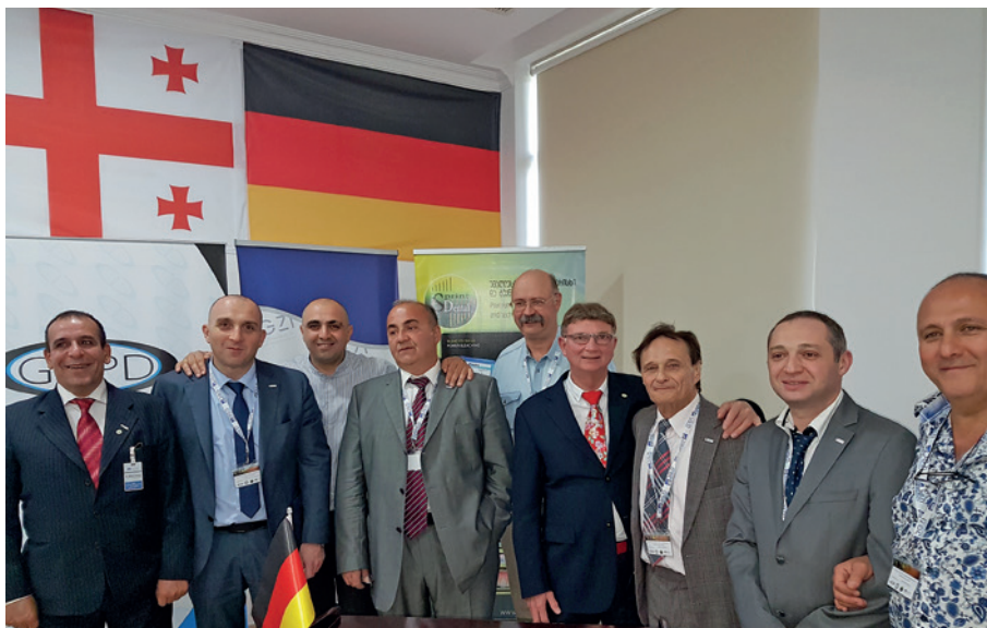
Abb. 1: Die Referenten des Kongresses freuen sich über eine gelungene Veranstaltung.

Die GLIPD ist seit 2015 offizieller Partner der DGZI. Es besteht eine Kooperationsvereinbarung bezüglich Kongressveranstaltungen und curriculärer Weiterbildungen.