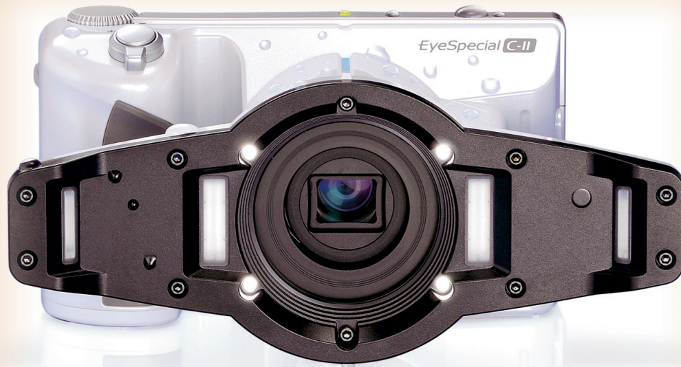
Equipment für professionelle Dental fotografie auf DENTALMAN.com

Mit der EyeSpecial C-II wird das dentale Fotografieren zum Kinderspiel. Die Kamera ist kompakt und mit ihren 465 Gramm ultraleicht, sodass sie mit nur einer Hand gehalten