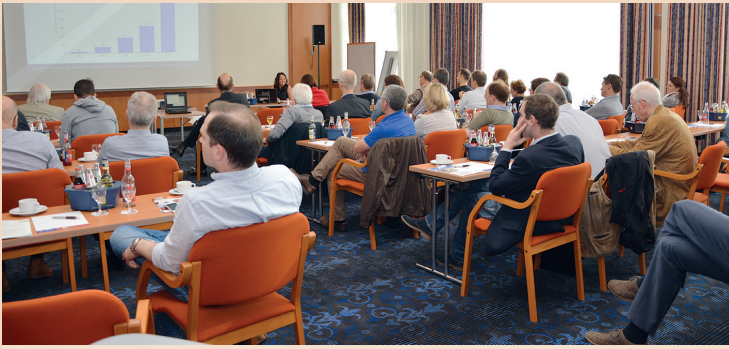
Dass der Workflow kieferorthopädischer Praxen eine zunehmende Digitalisierung erfährt, machte das Symposium „Digitale Kieferorthopädie“ der KFO-IG in Fulda deutlich.

Accusmile® 3D Software von FORESTADENT erobert kieferorthopädische Praxen.